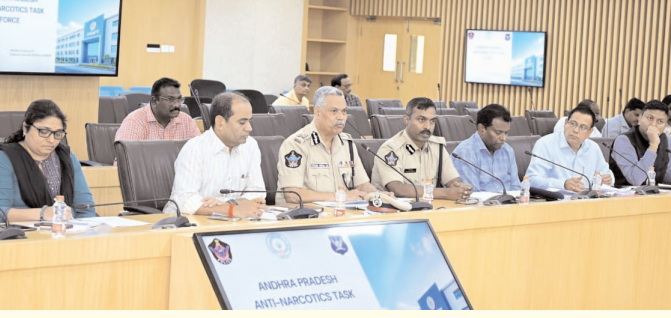
విశాఖపట్నం జిల్లా(నేటి శుభోదయ): సాంకేతిక పరిజ్ఞానం సాయంతో గంజాయి, డ్రగ్స్ నియంత్రణకు కఠిన చర్యలు తీసుకోవాలని విద్య, బడి శాఖల మంత్రి నారా లోకేష్ పోలీసు ఉన్నత అధికారులను